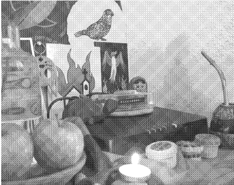
Aquí nuestro pequeño altar transhackfeminista

Si tienen un lugar seguro pueden crear su pequeño altar transhackfeminista y colocar allí la servidora conectada al router . Nosotras, por ejemplo, le pusimos nombre. ¡Háganla suya!, los rituales son importantes para nosotras.